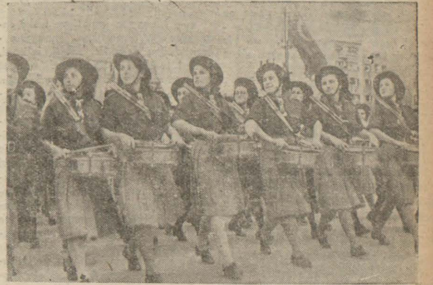
İstanbuldaki geçid resminde izci kızlarımızın geçişleri

Ankara 29 (Hususi) — Hükümet merkezinde Cumhuriyet bayramı me - rasimi büyük bir intizam içinde cere - yan etmiştir. Güneşli ve ilk bir hava unumi neşenin artmasına yardım eylemiştir. Saat 13 de Büyük Millet Meclisi binasında Cümhurreisî tebr - kâtı kabul etmiş ve Millî Şef sıhhatli çehresinden hiç eksik olmıyan sıcak tebessümle protokola dahil zevata ayrı ayrı iltifatta bulunmuştur. Bu merasimi takiben İpodromda ya - pılacak geçid resmindë bulunmak üzere Meclisten ayrılan sayın İsmet İnönü yanında Başvekil Dr. Refik Saydam olduğu halde açık bir oto - mobile iki tarafı halkla dolu cadde - lerden geçmiş ve şiddetli alkışlar top - lamıştır. Cümhurreisinin otomobil merasim sahasına dahil olduğu zaman İpodromu dolduran 30 bine yakın bü - yük bir halk kütlesi aziz Şefi çılgınca alkışlamış, «Yaşa, varol!» sesleri da - kikalarca etrafı çınlatmış ve bu ge - niş saha Millî Şefe sevgi ve bağlılık i - fade eden büyük tezahürlere sahne olmuştur. (Devamı 3 üncü sayfada)